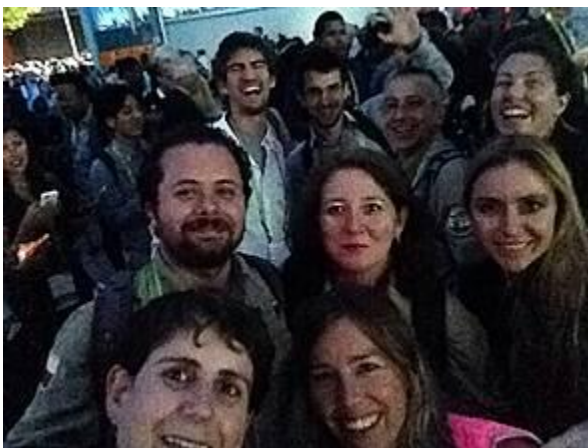
Izquierda: Parte de la delegación chilena en evento inaugural