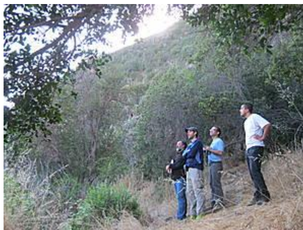
Equipo Técnico del Proyecto en la ecoregión mediterránea

La principal actividad de esta primera etapa es la del levantamiento de información turística de cada uno de los socios, lo que supone visitar a cada uno de los interesados en el turismo, realizando un catastro de servicios e infraestructura, recopilar material audiovisual (foto y video), y georeferenciación de atractivos, que apoye la difusión y comercialización de la oferta.