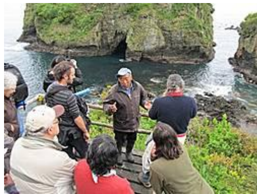
Mirador en Manquemapu, guía cuenta