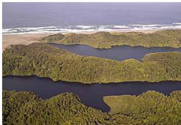
Lagunas Gemelas, Reserva Costera Valdiviana

En el sector costero de Chaihuín (Región de los Ríos), una empresa forestal sustituía el bosque nativo siempreverde por plantaciones de eucalipto. Esto acabó en el 2003, cuando la ONG The Nature Conservancy adquirió 60.000 hectáreas para crear lo que hoy se conoce como la Reserva Costera Valdiviana .