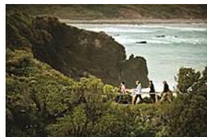
Arriba: Parque Ahuenco Abajo: Cliffs Preserve Patagonia