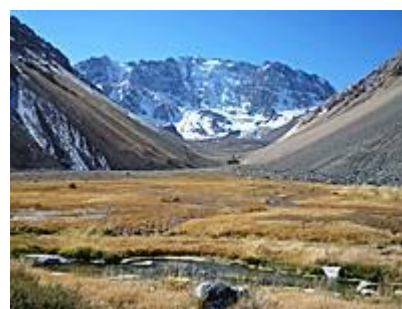
Vega en Juncal Andino

Para sumarte a Así Conserva Chile, baja las instrucciones y formularios de nuestro sitio web www.asiconservachile.org , sección "Súmate".