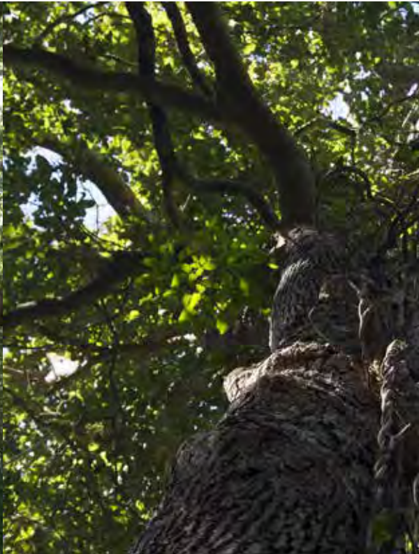
PEUMO Cryptocaria alba