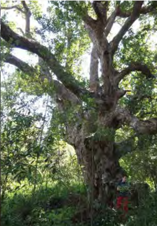
BELLOTO DEL NORTE Beilschmiedia miersii