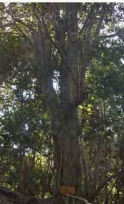
OLIVILLO Aextoxicon punctatum