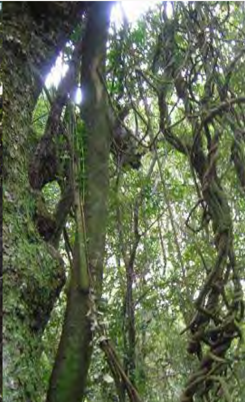
NARANJILLO Citronella mucronata